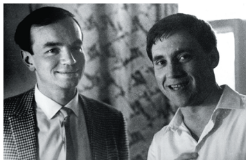
А. Вознесенский и В. Высоцкий в молодости.

А в ноябре того же 1965 года Андрей Вознесенский представил Высоцкого на концерте в Доме учёных Объединённого института ядерных исследований нашим физикам. И затем, вплоть до ухода из жизни В. Высоцкого в 1980 году, они посещали наш город. Иногда вместе. Высоцкий, по воспоминаниям сотрудников ОИЯИ, не раз бывал в гостях в номере 326 нашей гостиницы у Вознесенского: Андрей Андреевич иногда подолгу жил в гостинице «Дубна». А если В. Высоцкий приезжал в Дубну на спектакль с «Таганкой» или на один из многочисленных своих сольных концертов, проходивших обычно в ДК «Мир» или ДК «Октябрь», и оказывалось, что этот номер свободен, он обязательно селился именно в нём. Так что можно сказать, что в номере 326 нашей гостиницы останавливался не только великий поэт Андрей Вознесенский, но и великий поэт Владимир Высоцкий. И этот факт вдвойне приятен жителям города.