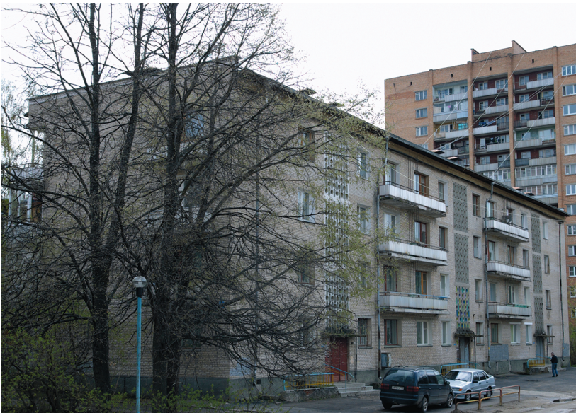
Улица Ленинградская, дом 3