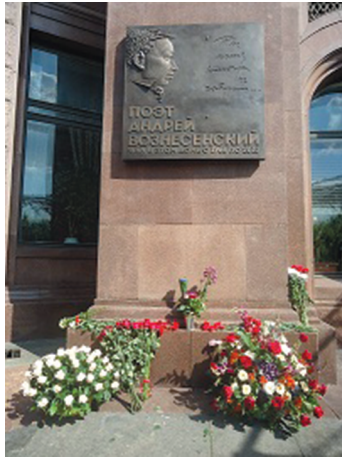
Мемориальная доска на доме, в котором жил А. Вознесенский

12 мая 2013 года Поэту исполнилось бы 80 лет... В связи с этой знаменательной датой в Москве были проведены праздничные мероприятия: