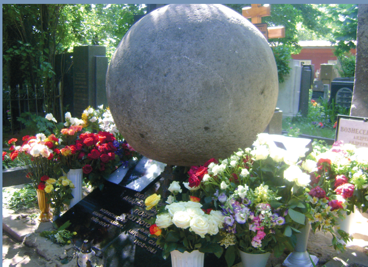
Могила А.А. Вознесенского

«...Все публикации, вечера памяти, спектакли, посвящённые юбилею Вознесенского, длятся до 12 мая 2014 года, когда ему исполняется 81 год. Его юбилейный год исчисляется от одного дня рождения до следующего. Большинство событий падает как раз на январь, февраль, март».