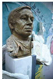
Бюст А. Вознесенского

Понять эти особенности его поэзии, окунуться в их таинственную глубину или взмыть в их заоблачные выси должен попытаться сделать каждый читатель самостоятельно. Следующие за нами поколения тоже будут по-своему пытаться осмысливать, понимать и разгадывать его поэзию, потому что творчество Вознесенского — навсегда, на века, оно — вне времени. И я уверена, что многим из нас будет даровано право разгадать зашифрованные коды гениальных поэтических посланий одного из выдающихся поэтов планеты Андрея Андреевича Вознесенского.